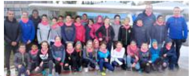
Les élèves de l'école, accompagnés de leurs parrains.

Jeudi, les enfants de l'école fondamentale libre Sainte-Marie, qui propose cette organisation, peaufinaient